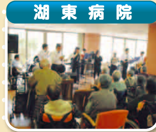
▲「バンド演奏」 ボランティアさんに手品や演奏を披露していただきました。