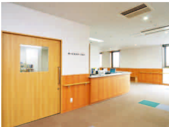
サービスステーション

30年以上に渡り、地域の皆さまに親しまれてきた湖東病院の1号館が湖東ケアセンターとして生まれ変わりました。少しですが紹介させていただきます。