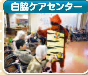
▲「節分」 鬼についている紙風船をつぶして鬼退治を行いました。福をたくさん呼び込めました。