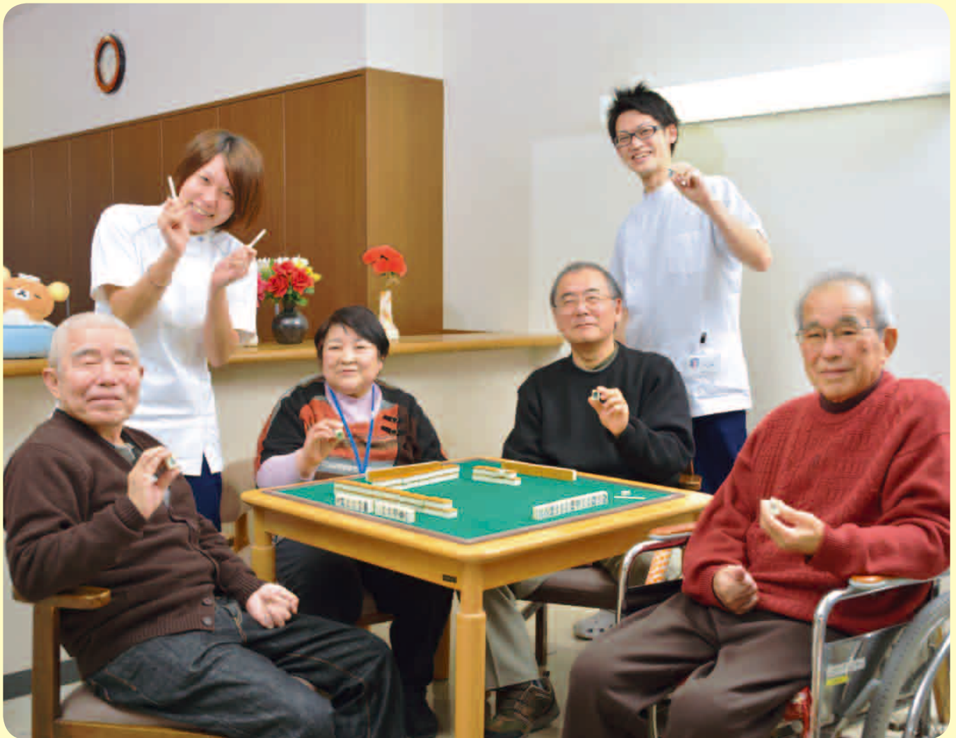
※個人情報保護法により、御本人の同意を得て掲載しております。