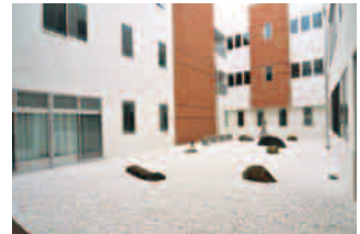
開放感のある中庭