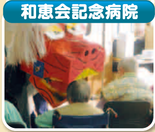
▲「新年会」 獅子舞に頭をかまれると厄除けになるという言い伝えがありますよね…。