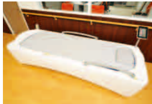
充実した機能訓練室には ウォーターベッドも導入