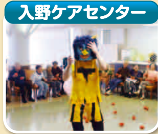
▲「豆まき」 「鬼は外!」と、鬼に向かって豆をまき、鬼退治をしました。