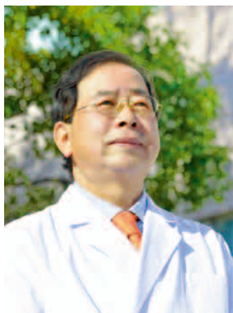
医療法人社団和恵会

ター(浜松市委託事業)も作り高齢者のあらゆるご相談を受け付けることにしました。それは、其の当時から「地元で老いて地元で住み続ける」ことが出来る社会作りを貢献し、この浜松が老後も真に住みやすい所となれば良い、との思いからです。今年4月から中区高丘西二丁目32-36に老人保健施設「みずほケアセンター」を浜松開拓農協のご協力を得て開設いたしました。そこでも既存施設と同じように各種サービスを併設し運営してまいります。地元の方々に取り利便性の高い施設運営を目指します。そして当法人の活動が長生きした結果として仮に認知症が出たとしても安心して老後を送ることが出来る街作りの一助になれば幸いです。