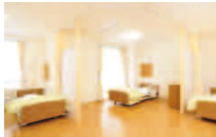
パーティーにより、 プライバシーに配慮した居室