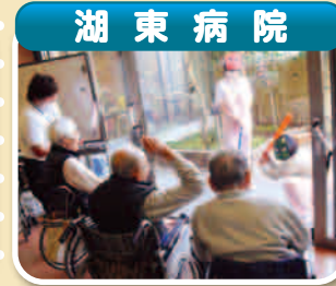
▲「みんなで鬼退治」 鬼が去り、これで今年も安心です。