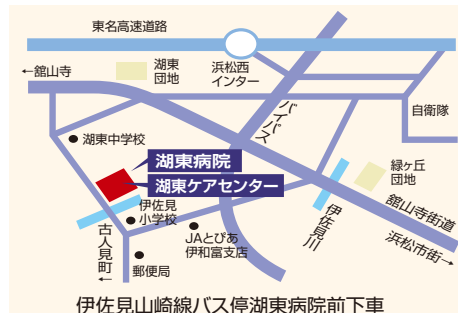
伊佐見山崎線バス停湖東病院前下車