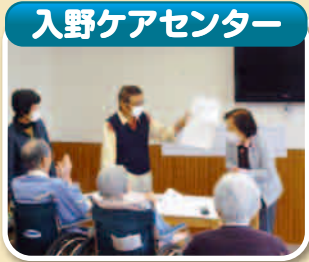
▲「ボランティア」 お話ボランティアさんと懐かしい曲を歌いました。