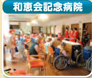
▲「クリスマス会」 ハンドベルの音色が素敵でした。