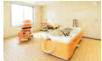
入所者の身体レベルに合わせて 入浴可能な浴槽