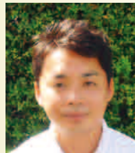
白脳ケアセンター