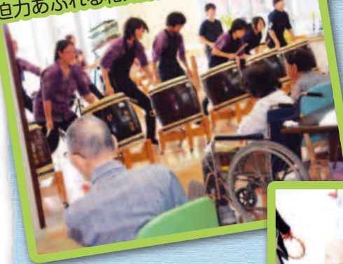
迫力あふれる和太鼓の演奏