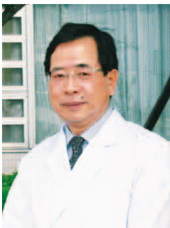
医療法人社団 和恵会 理事長

以上、述べてきたことは個人的な感想ですが、いずれにせよ世の中は大きな変革期を迎えていることに違いはないようです。そんな中で医療、介護、福祉だけ無風の状況が続くとも思えません。時代の波という大きなうねりになっても当法人は掲げる理念に従い高齢者への医療、介護、福祉やリハビリを守って行きます。