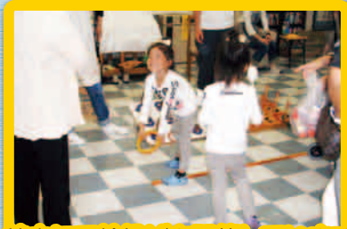
館内にて輪投げを開催しています。参加した方へのお菓子のプレゼントもあります。