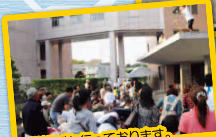
お餅投げも行っております。たくさん拾っていただけただでしょうか？