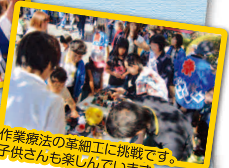
作業療法の革細工に挑戦です。子供さんも楽しんでいます。