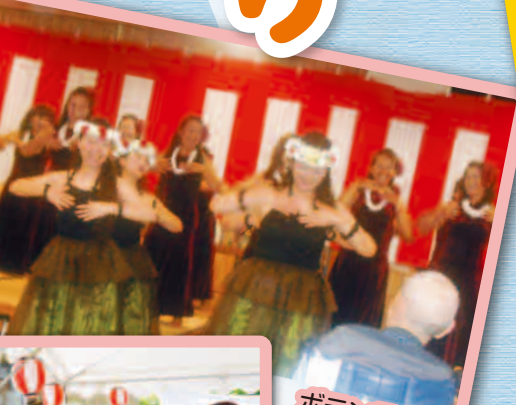
ボランティアによるフラダンスの披露です。まるで南国にいる気分です。