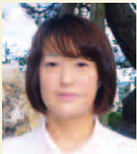
入野ケアセンター