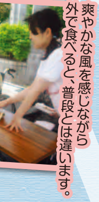
爽やかな風を感じながら外で食べると、普段とは違います。