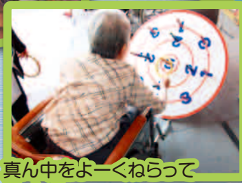
真ん中をよーくねらって エイツ!!

ご家族様だけではなく、ご近所の方や子供さんまでみなさんに楽しんでいただけるようにそれぞれ工夫を凝らしています。