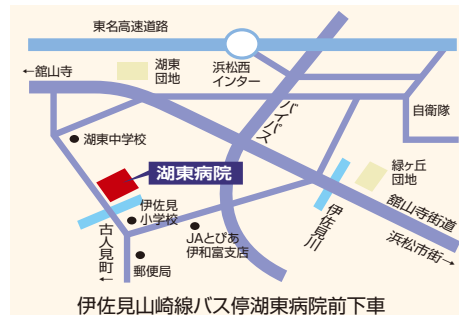
伊佐見山崎線バス停湖東病院前下車

伊佐見訪問看護ステーション TEL.053-486-3883 FAX.053-484-3338 ケアプランセンター湖東 TEL.053-486-5566 FAX.053-484-3338 ヘルパーセンター浜松(湖東出張所) TEL.053-484-3553 FAX.053-484-3338