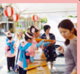
真剣な眼差しの射的です。狙い通り射止めることは出来たかな？