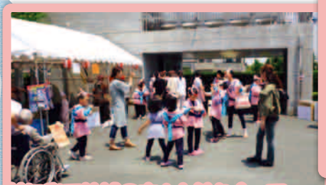
外に出て地域の方々と触れ合って 1日お祭り気分を味わいます。