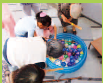
「私は赤いのを狙おうかしら…」 なんて談笑しながらも ついつい真剣になっちゃいます