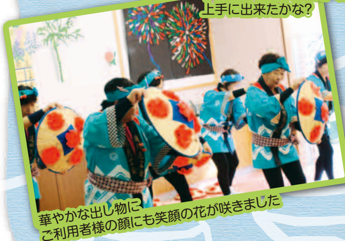
華やかな出し物に ご利用者様の顔にも笑顔の花が咲きました

5月の土日に開催しています。 懐かしい射的ゲームに大はしゃぎ! 良い物当たるかな?