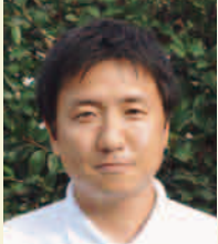
医療法人社団和恵会