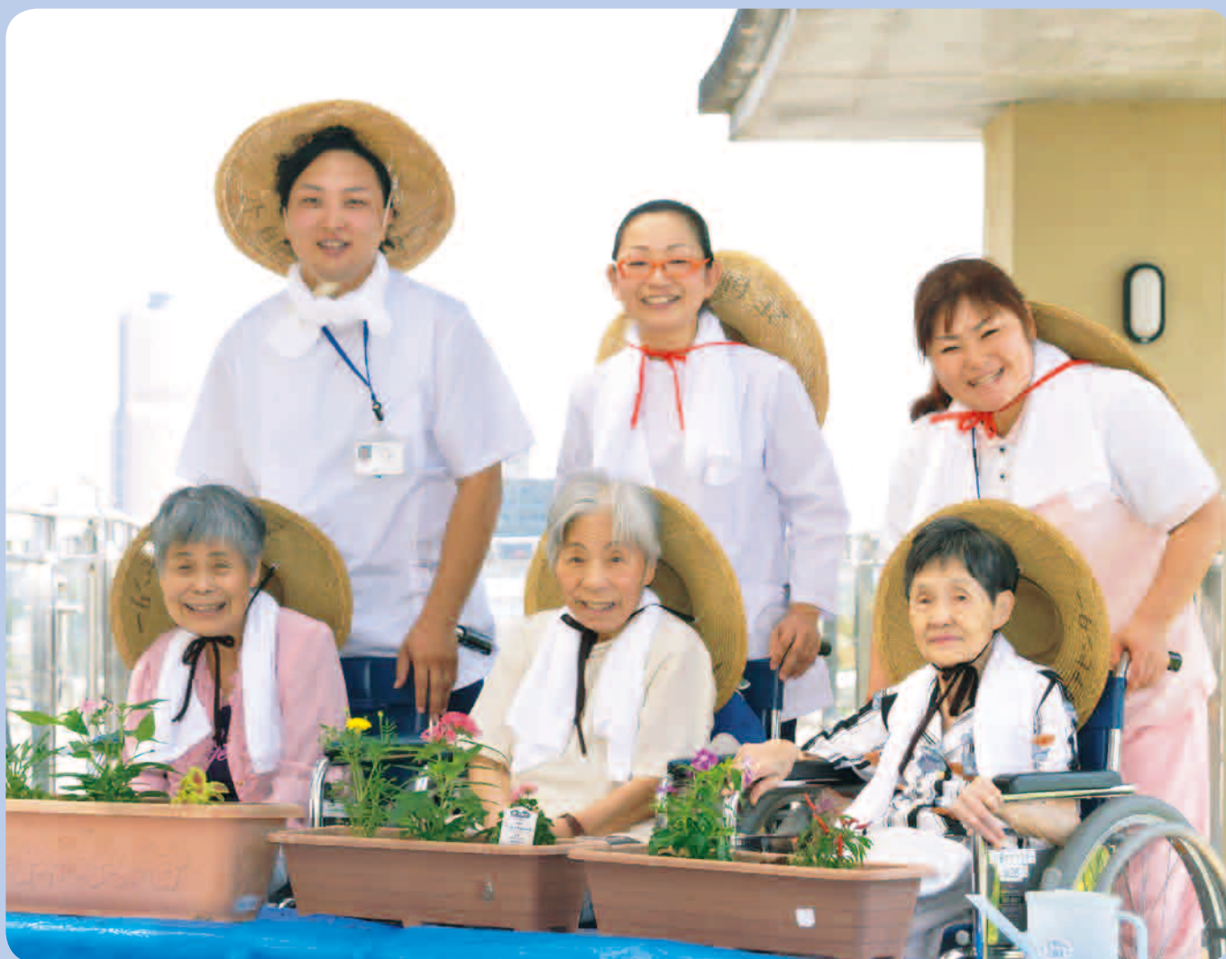
※個人情報保護法により、御本人の同意を得て掲載しております。