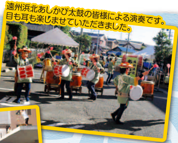
遠州浜北あしかび太鼓の皆様による演奏です。目も耳も楽しませていただきました。