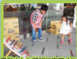
子供さんも遊びに来てくれました。 上手に出来たかな?