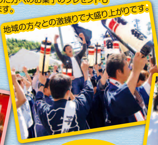
地域の方々との激練りで大盛り上がりです。