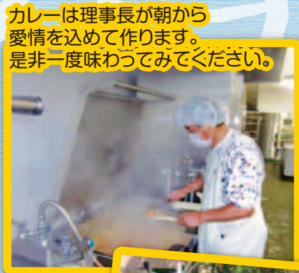
カレーは理事長が朝から愛情を込めて作ります。是非一度味わってみてください。