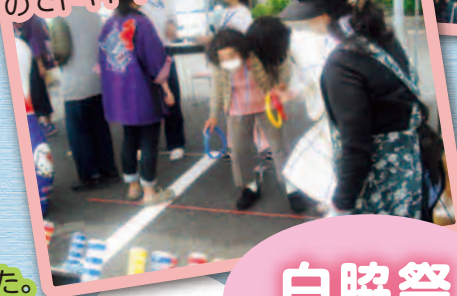
露店の輪投げです。 点数によって景品が変わるのでドキドキです。